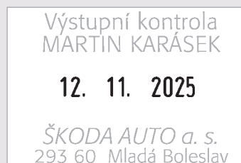
3360 30 x 45 mm