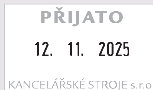
3160 24 x 41 mm