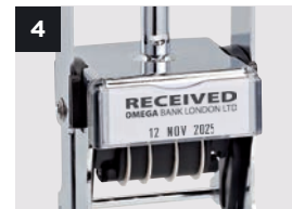
Image okénko nabízí prostor pro znázornění otisku