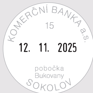
R 3040-Dater Ø 40 mm